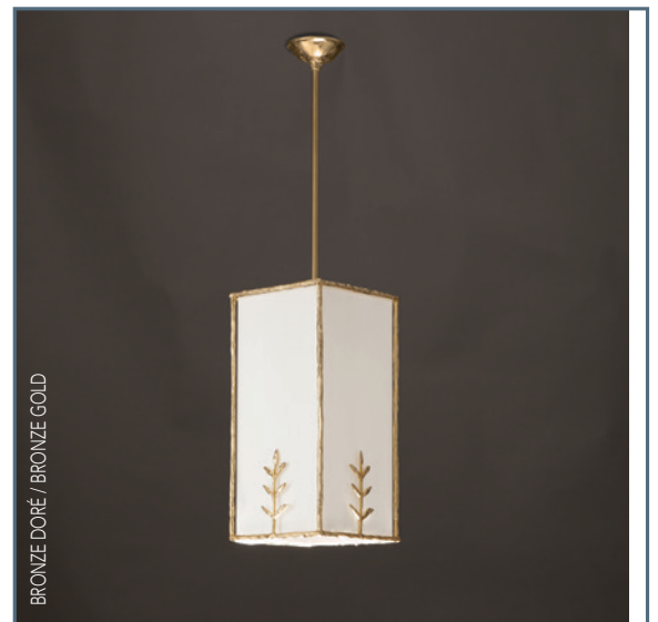
BRONZE DORÉ / BRONZE GOLD