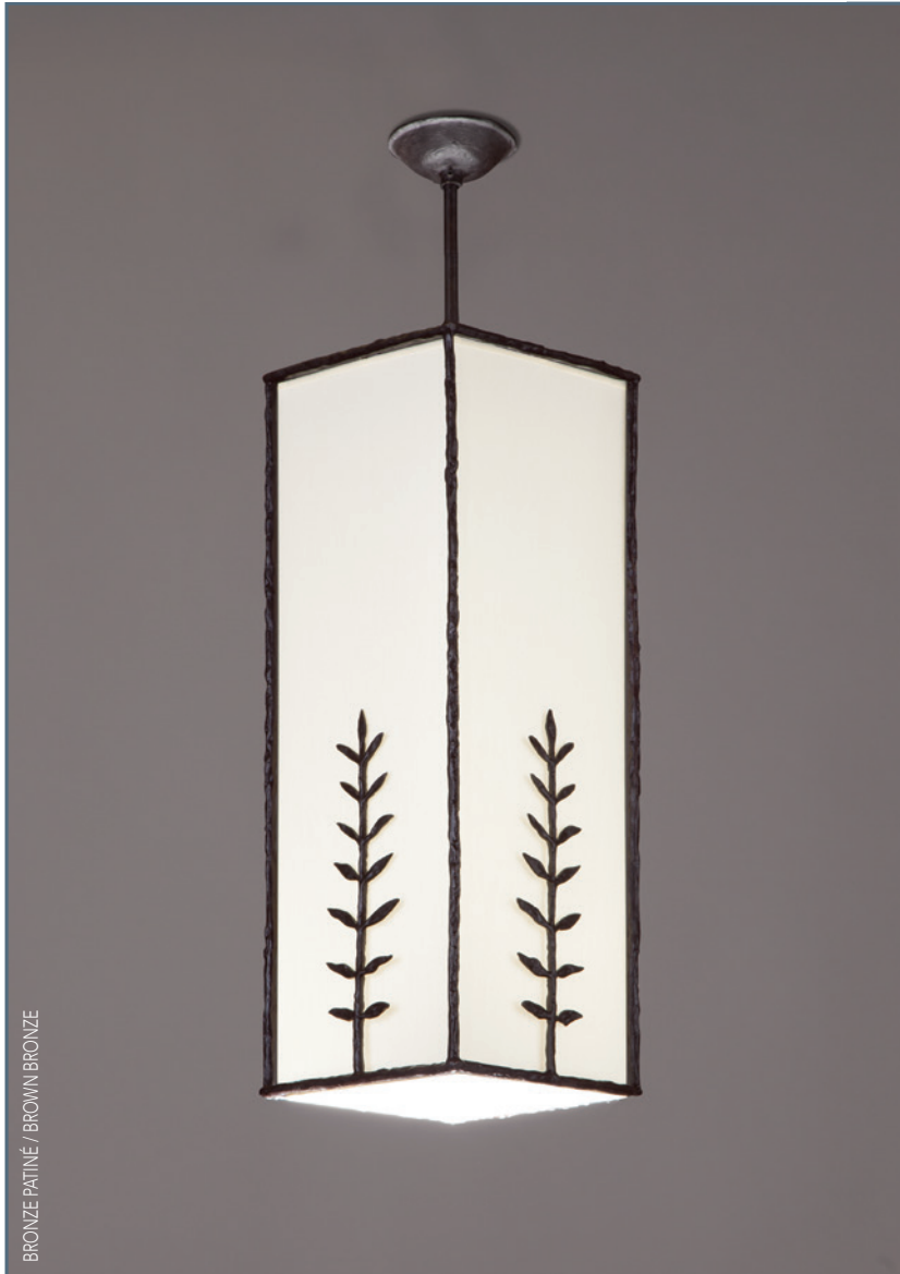
BRONZE PATINÉ / BROWN BRONZE