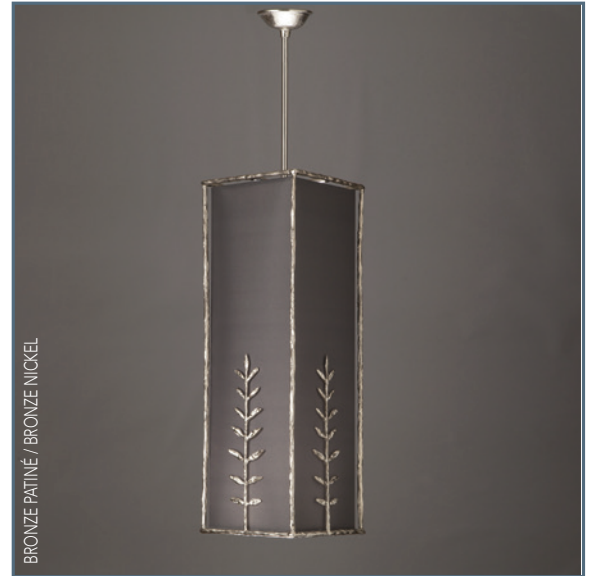
BRONZE PATINÉ / BRONZE NICKEL