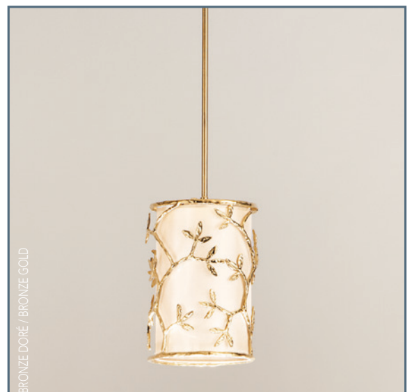
BRONZE DORÉ / BRONZE GOLD