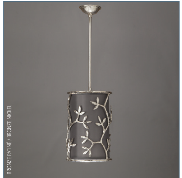
BRONZE PATINÉ / BRONZE NICKEL