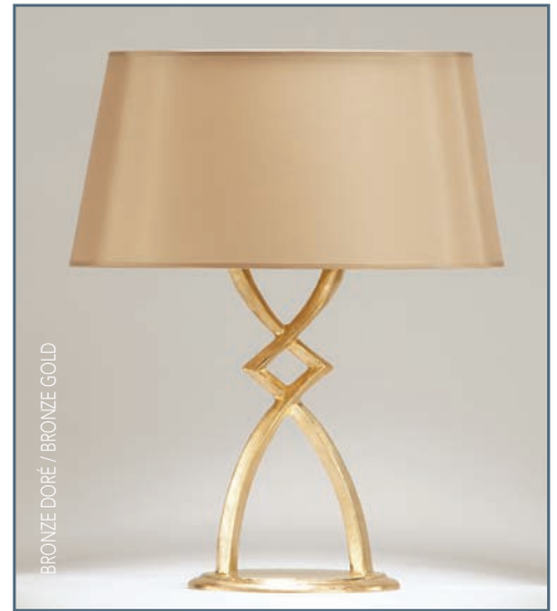
BRONZE DORÉ / BRONZE GOLD