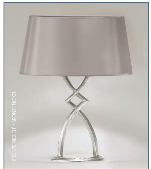
BRONZE NICKELÉ / BRONZE NICKEL