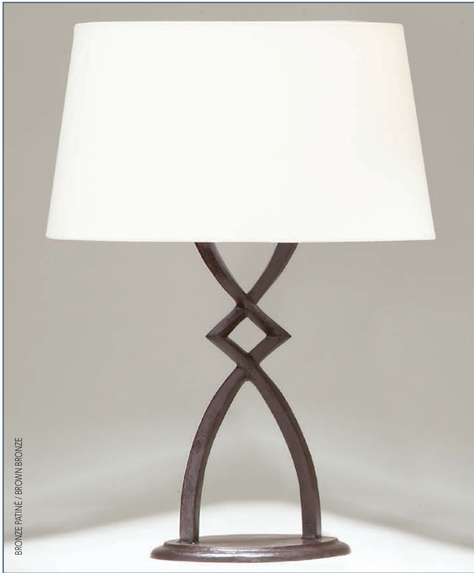
BRONZE PATINÉ / BROWN BRONZE