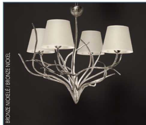
BRONZE NICKELÉ / BRONZE NICKEL