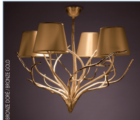
BRONZE DORÉ / BRONZE GOLD