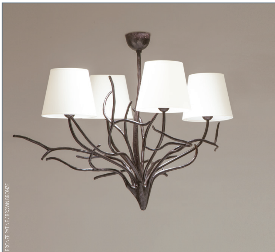
BRONZE PATINÉ / BROWN BRONZE