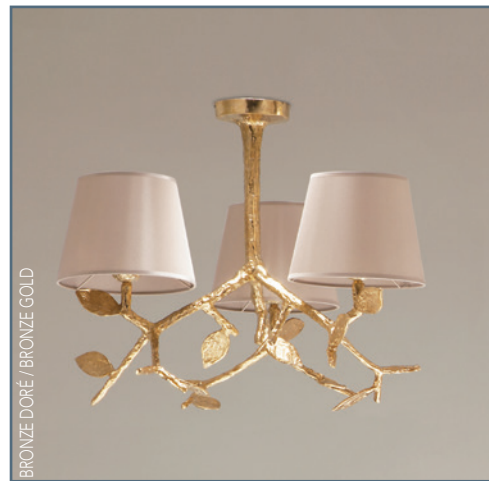
BRONZE DORÉ / BRONZE GOLD