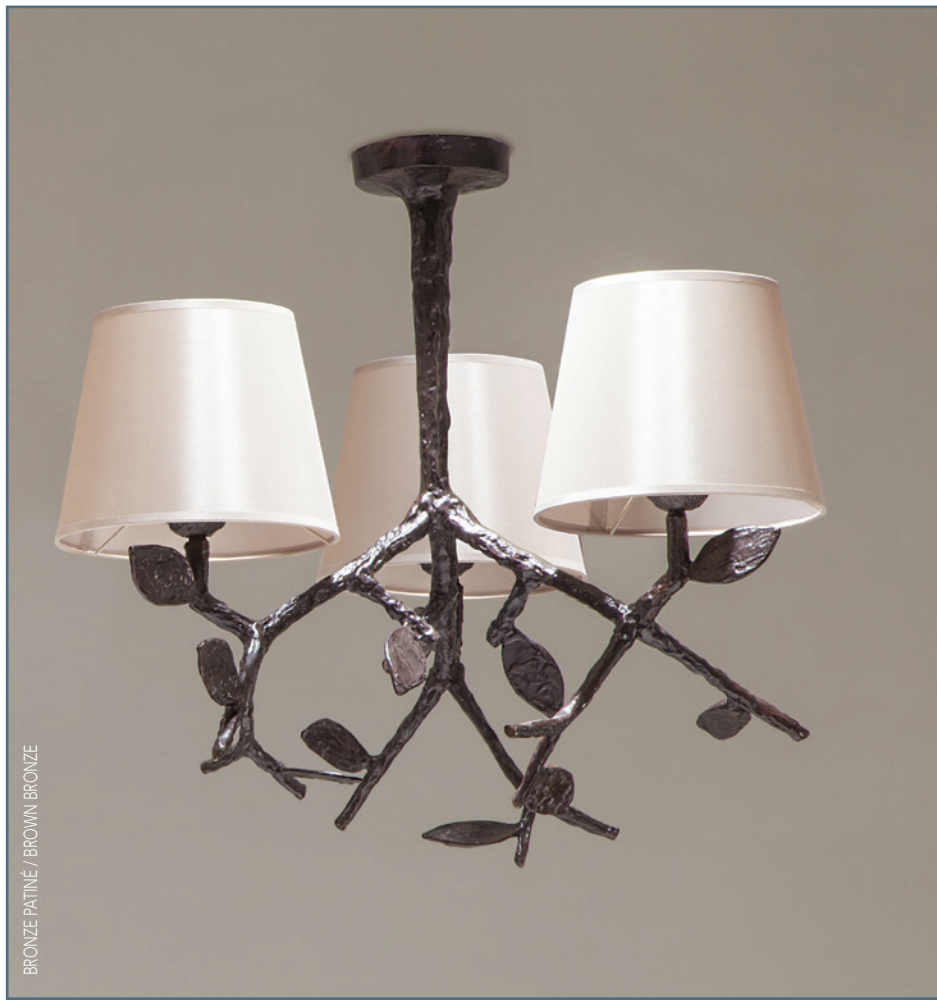
BRONZE PATINÉ / BROWN BRONZE