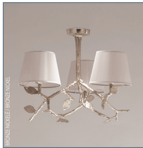
BRONZE NICKELÉ / BRONZE NICKEL