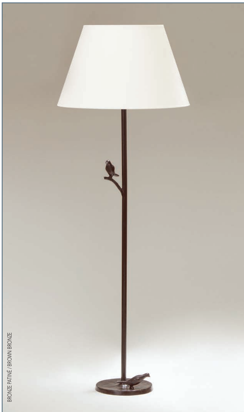
BRONZE PATINÉ / BROWN BRONZE