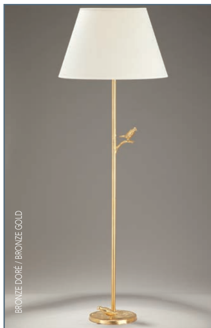
BRONZE DORÉ / BRONZE GOLD