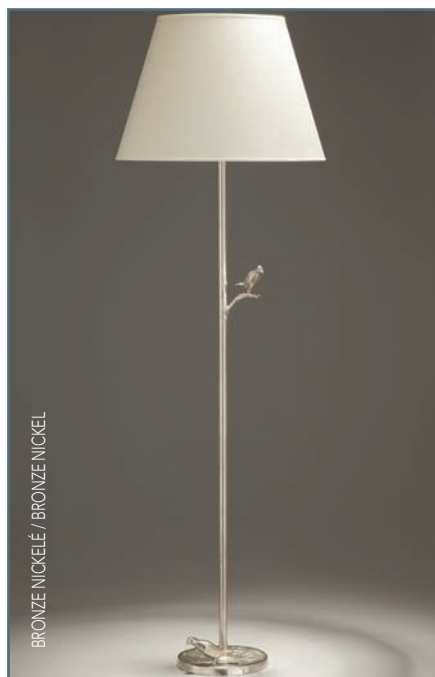
BRONZE NICKELÉ / BRONZE NICKEL