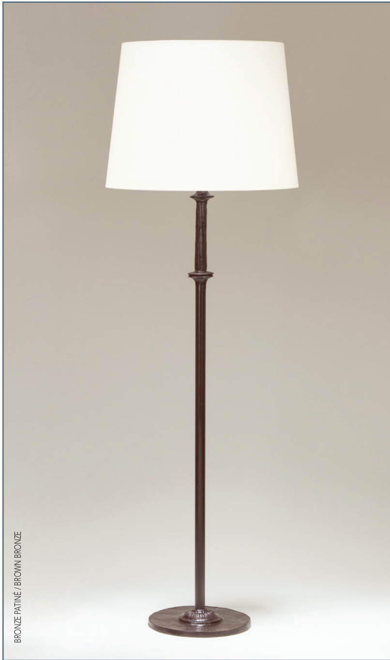
BRONZE PATINÉ / BROWN BRONZE