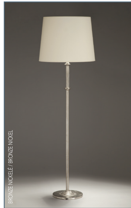
BRONZE NICKELÉ / BRONZE NICKEL