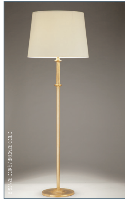
BRONZE DORÉ / BRONZE GOLD