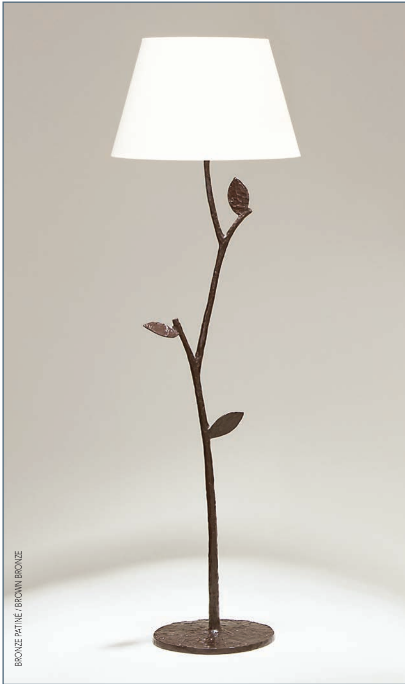
BRONZE PATINÉ / BROWN BRONZE