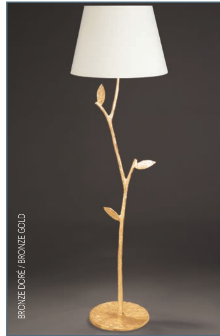
BRONZE DORÉ / BRONZE GOLD