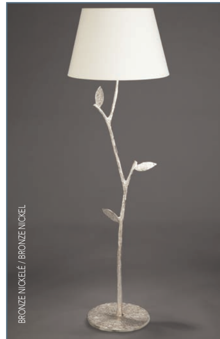
BRONZE NICKELÉ / BRONZE NICKEL