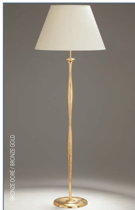
BRONZE DORÉ / BRONZE GOLD