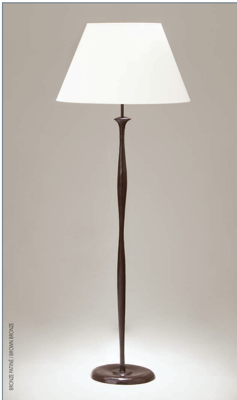
BRONZE PATINÉ / BROWN BRONZE