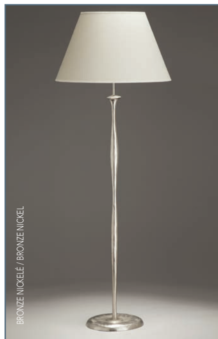
BRONZE NICKELÉ / BRONZE NICKEL