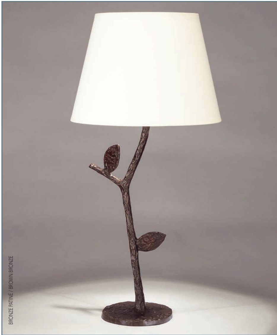
BRONZE PATINÉ / BROWN BRONZE