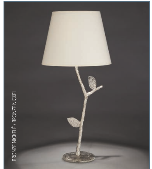
BRONZE NICKELÉ / BRONZE NICKEL