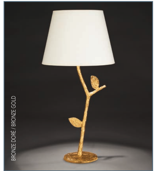
BRONZE DORÉ / BRONZE GOLD