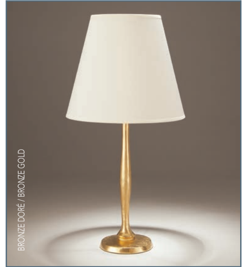
BRONZE DORÉ / BRONZE GOLD