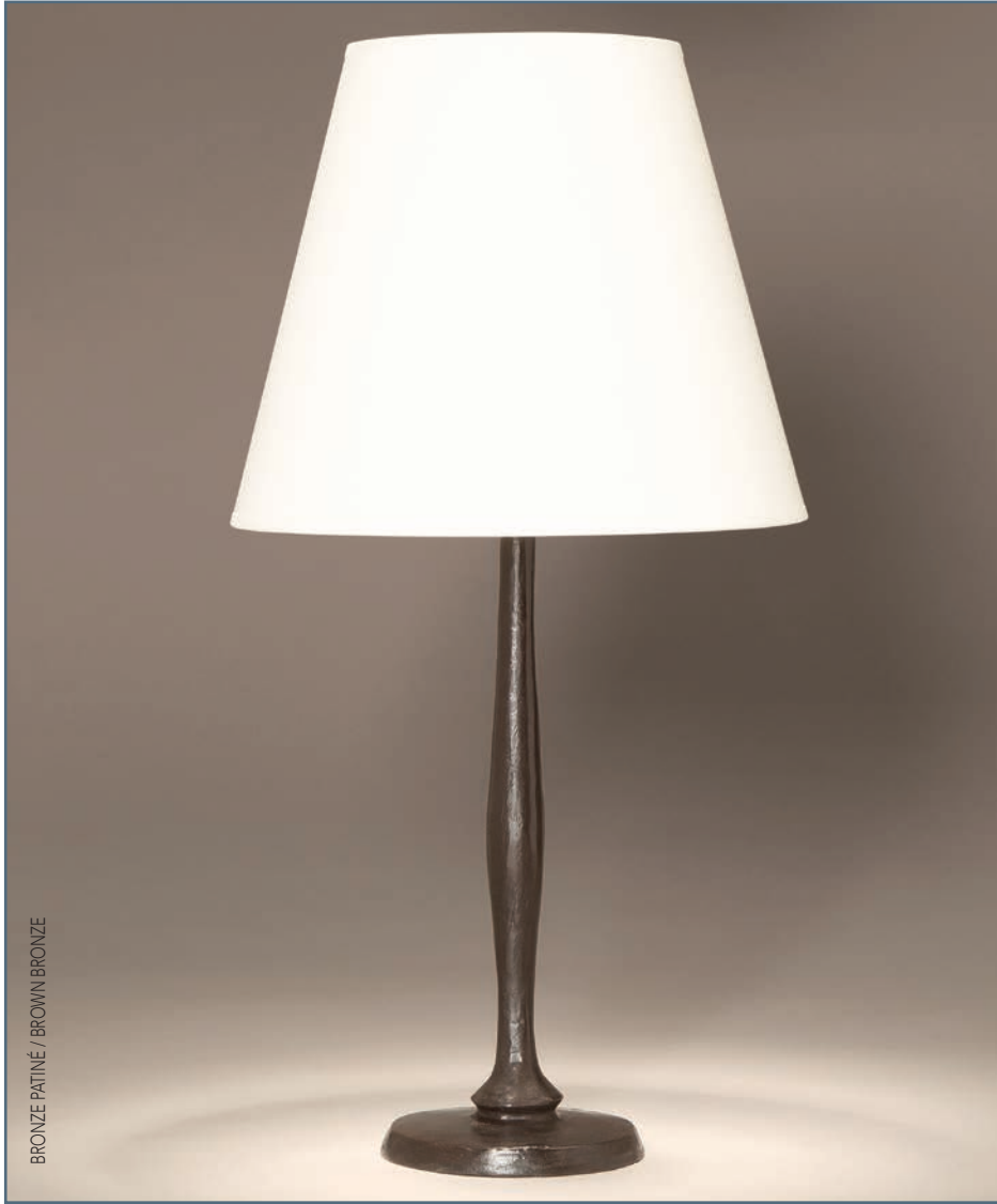
BRONZE PATINÉ / BROWN BRONZE