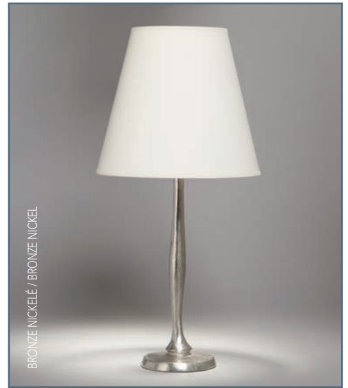
BRONZE NICKELÉ / BRONZE NICKEL