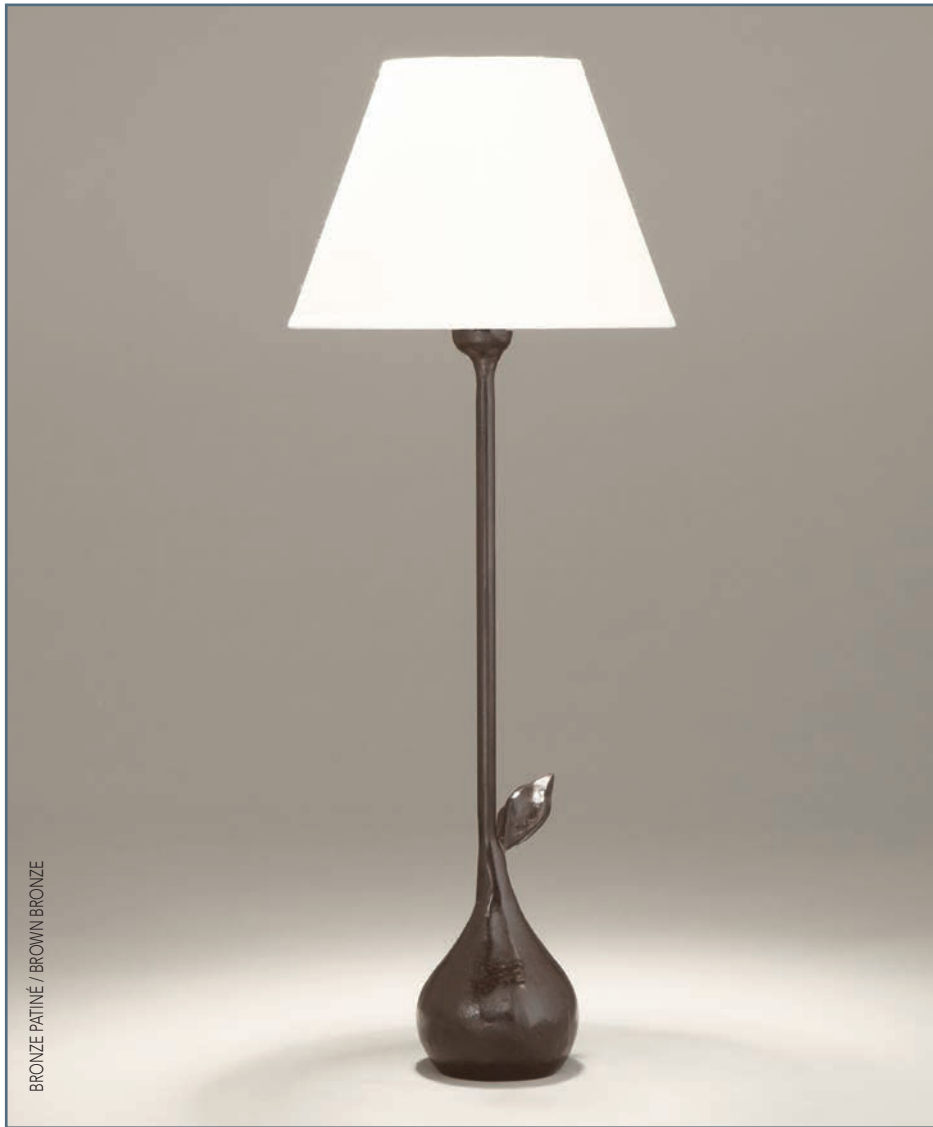
BRONZE PATINÉ / BROWN BRONZE