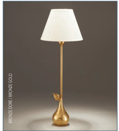
BRONZE DORÉ / BRONZE GOLD