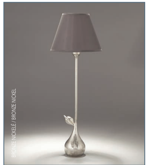
BRONZE NICKELÉ / BRONZE NICKEL