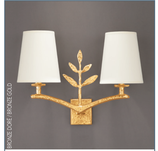
BRONZE DORÉ / BRONZE GOLD