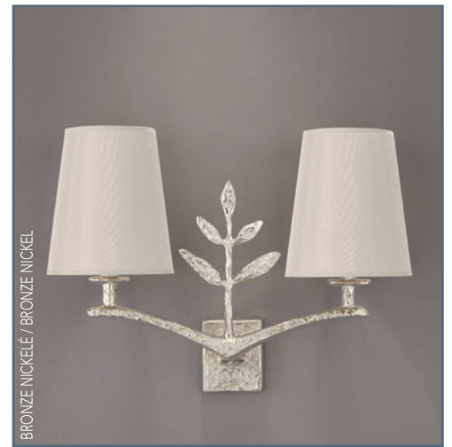
BRONZE NICKELÉ / BRONZE NICKEL