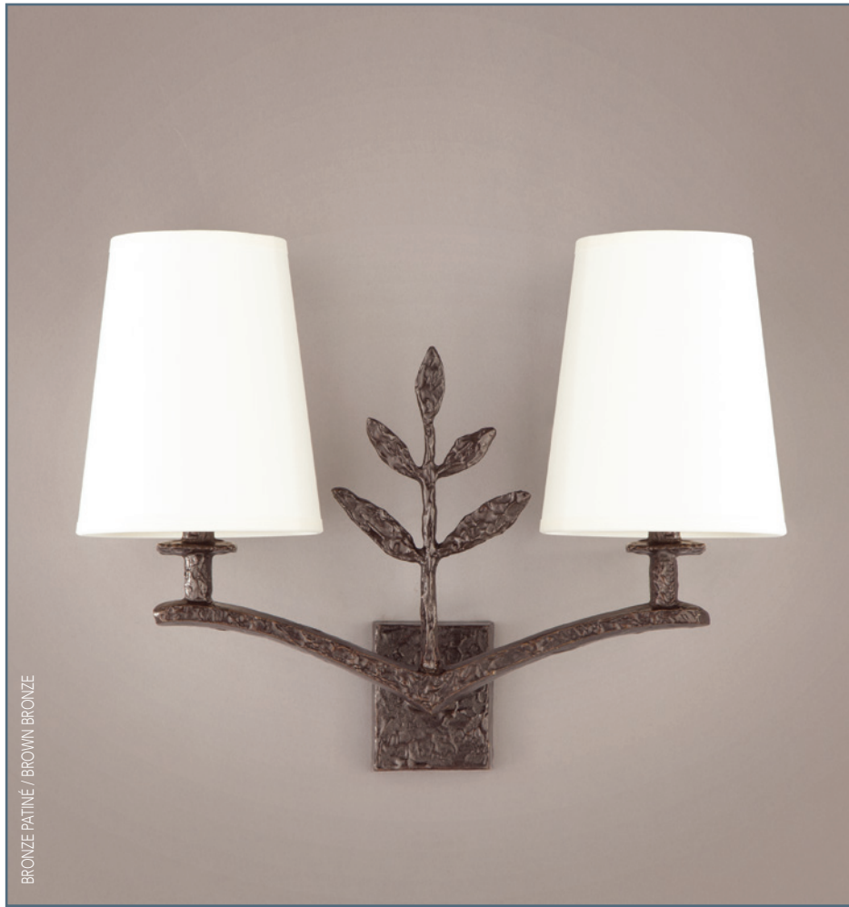
BRONZE PATINÉ / BROWN BRONZE