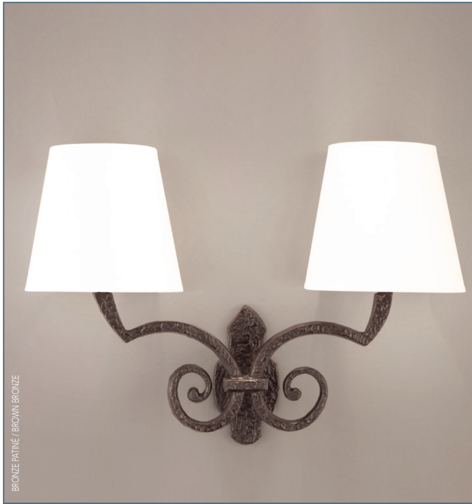
BRONZE PATINÉ / BROWN BRONZE