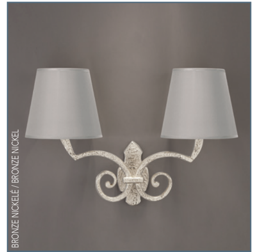
BRONZE NICKELÉ / BRONZE NICKEL