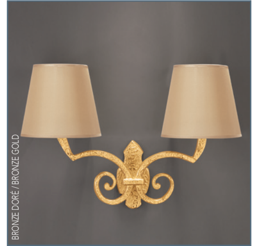
BRONZE DORÉ / BRONZE GOLD