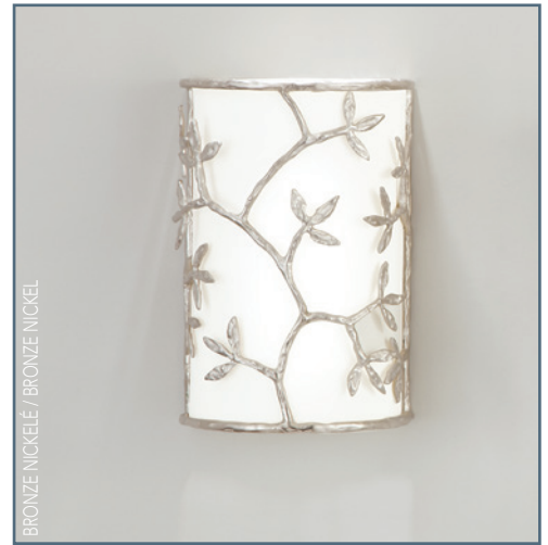
BRONZE NICKELÉ / BRONZE NICKEL