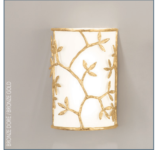
BRONZE DORÉ / BRONZE GOLD