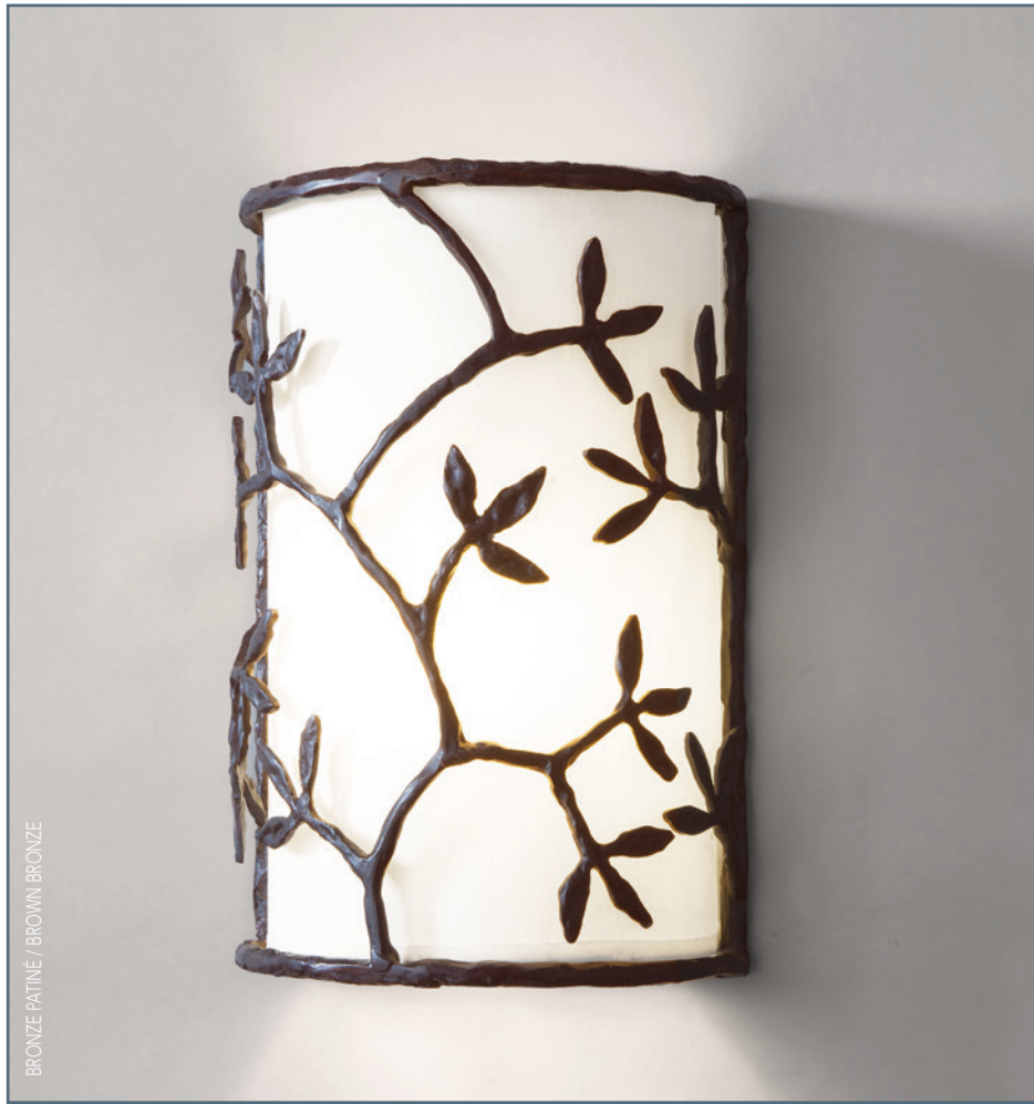
BRONZE PATINÉ / BROWN BRONZE